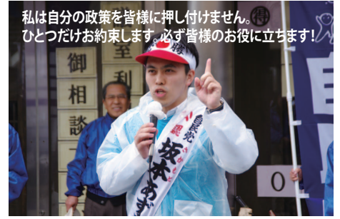
私は自分の政策を皆様に押し付けません。 ひとつだけお約束します。必ず皆様のお役に立ちます!