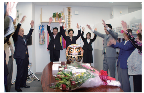
夜の部には遊説部や車両部など頼もしい男性陣が参加