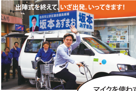
出陣式を終えて、いざ出発。いってきます!