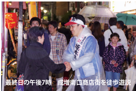
最終日の午後7時 成増南口商店街を徒歩遊説