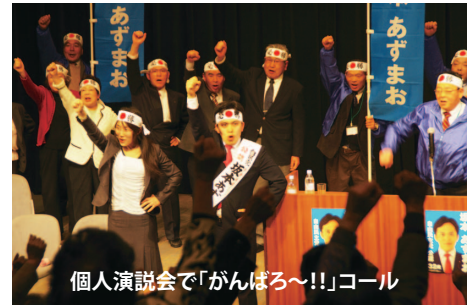
個人演説会で「がんばろ〜!!」コール