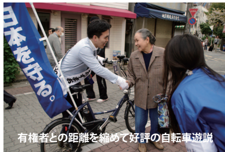
有権者との距離を縮めて好評の自転車遊説