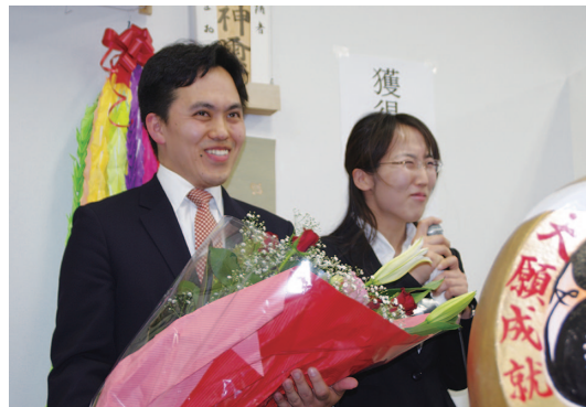
笑顔でこの日を迎えることができました