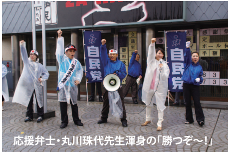
応援弁士・丸川珠代先生渾身の「勝つぞ〜!」