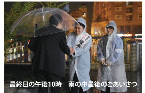
最終日の午後10時 雨の中最後のごあいさつ