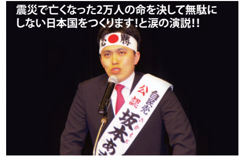
震災で亡くなった2万人の命を決して無駄に しない日本国をつくりまします!と涙の演説!!