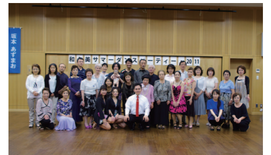
最後は仲良く集合写真