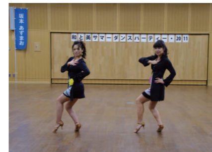
アマチュアデモンストレーションを華麗に披露してくださった方々