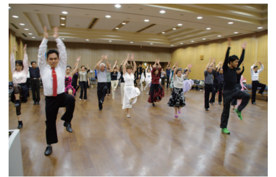
見た目よりハードなラテン系エクササイズZUMBA

区民の健康増進を目的として毎年行っているサマーダンスパーティーには、今回も約80名のアマチュアダンサーが集まり、ダンスタイム、ミキシング、アマチュアデモンストレーションなどをお楽しみいただきました。なかでも、話題の脂肪燃焼系健康エクササイズ「ZUMBA」は大人気で、あずまおオリジナルの振り付けを、きよしのずんどご節に合わせてリズムカルに踊りました。ダンスが踊れない方でも気軽に参加できるところが良かったようです。次回もお楽しみに。