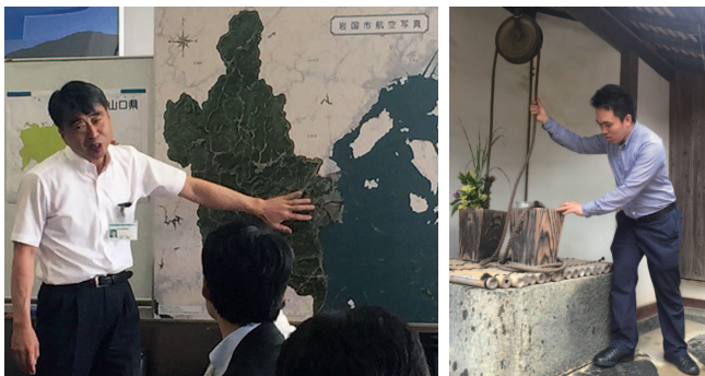
左：岩国市より基地と米軍・自衛隊との防災連携の説明 右：明治の政治家・木戸孝允の生家にて

自民党板橋区議団として、山口県の萩市と岩国市を視察しました。板橋に本拠地を置くバイオ研究で有名な「野口研究所」周辺歴史遺産群の保存と活用に向け、世界遺産にも指定された萩市の近代化産業遺産と関連施設、および巨大災害の公助の役目を果たす海上自衛隊岩国基地を訪問しました。保存が危ぶまれている野口研究所内の歴史遺産の維持・保護の推進、そして安全保障を保つべく尽力していきます。